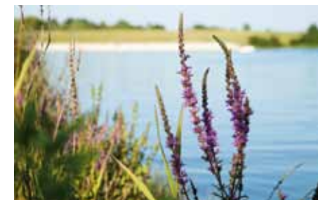
Une faune et une flore préservées