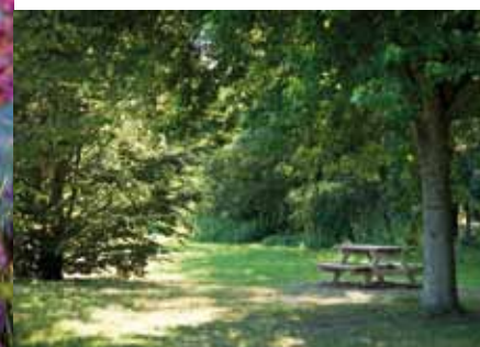
Des aires de pique-nique

Nature, détente, loisirs ou activités sportives... un panel d'activités vous est proposé en venant à La Monnerie. En liaison avec le Centre permanent d'initiatives pour l'environnement (CPIE) Vallées de la Sarthe et du Loir, nous vous proposons un large éventail de thèmes à explorer.