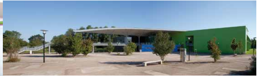
Un espace multisports de 44 x 24 m