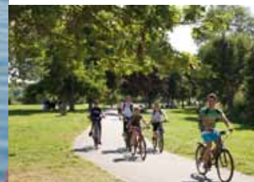
Piste goudronnée de 3 km