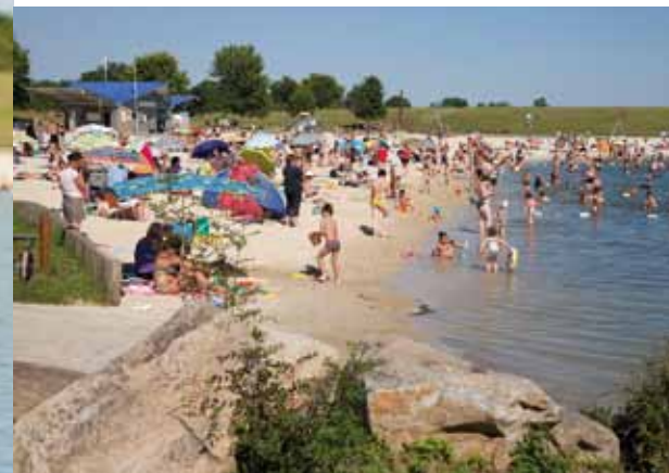
Plage et baignade surveillée en saison